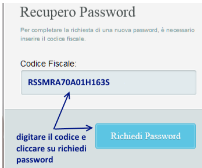
Fig. 7 recupero password ulteriore conferma digitazione del codice fiscale

Per una ulteriore verifica di sicurezza il sistema chiederà di digitare il codice fiscale dell'utente.