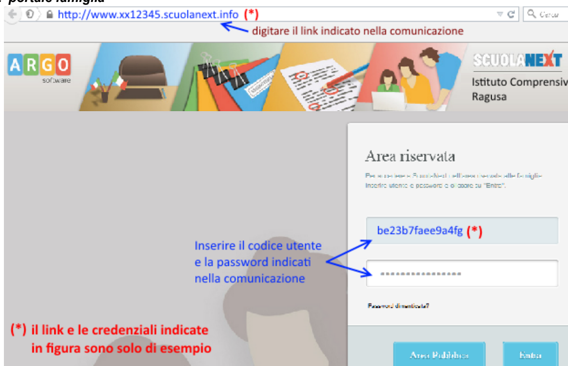
Fig. 2 portale famiglia

Basta avere un pc collegato ad internet, aprire il browser di navigazione ( consigliati mozilla firefox e google chrome ) e digitare o incollare il link indicato nella comunicazione.